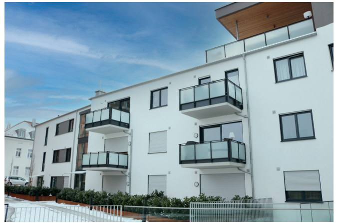
Projekt „An der Alten Brauerei Dietl“ in Straubing